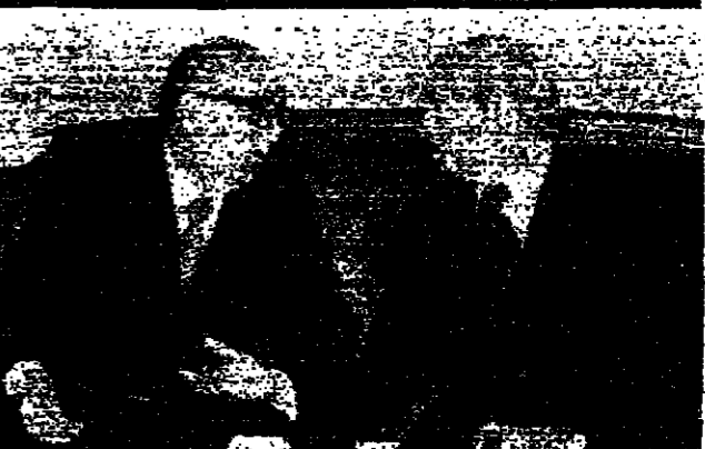
عنان - ر - ا.ش.